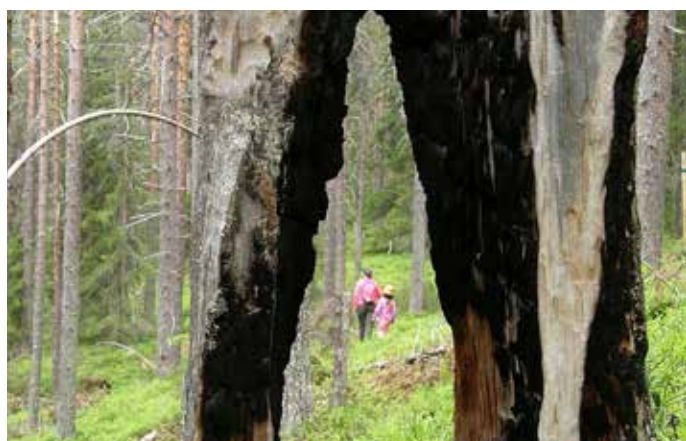
Retkeilijöitä Kuusamon livaaralla.

Lähteet: Teos Jokamiehenoikeudet ja toimiminen toisen alueella sekä ymparisto.fi