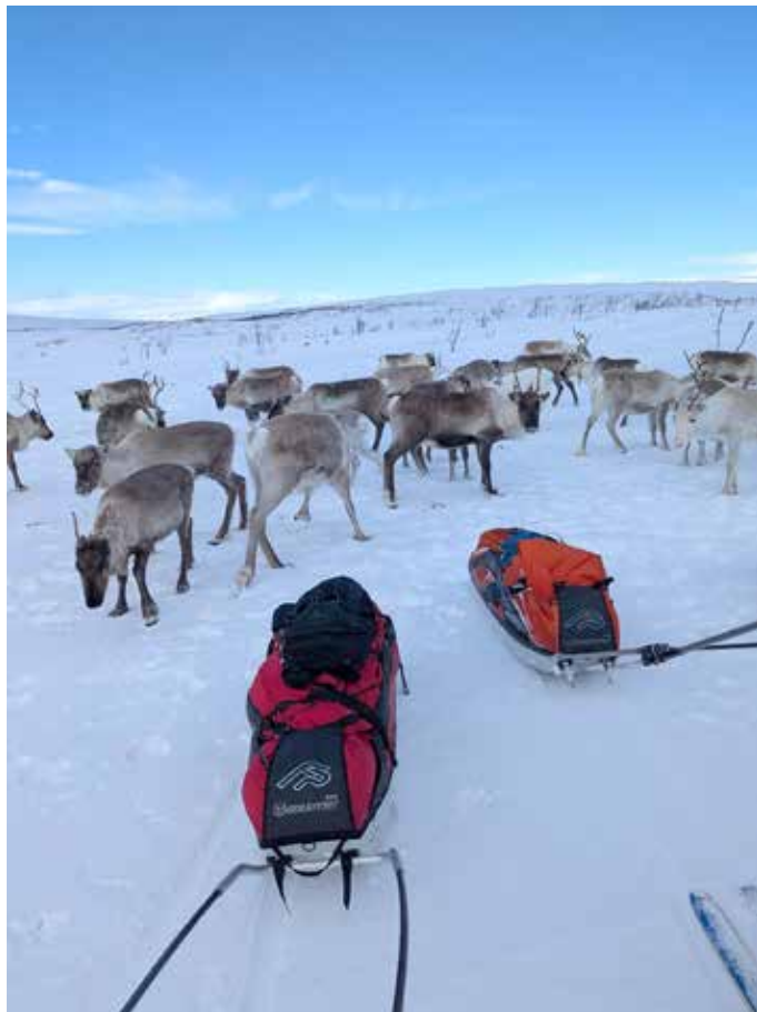
Sorry, emme tuoneet heinää.

voisi kertoa seuraaville vierailleen, mikä on tilanne. Juuri kun olimme nousseet Lätäskurkkion jäältä mantereelle evästauolle, paikalle tuli murtomaahiihtäjä. Häneltä saimme tiedon, että kelkkaura jatkuu Iso-Kurkkion at:lle ja siitä vielä muutaman km:n kalastajien apa-