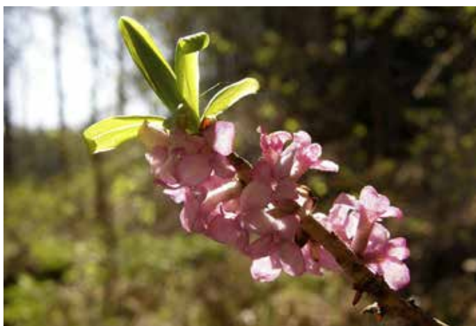
Näsia kukkii Hämeenlinnan Aulangolla.