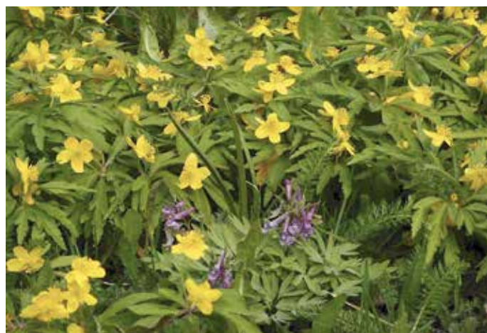
Keltavuokkoja ja kiurunkannuksia Hattulan Lepaalla.