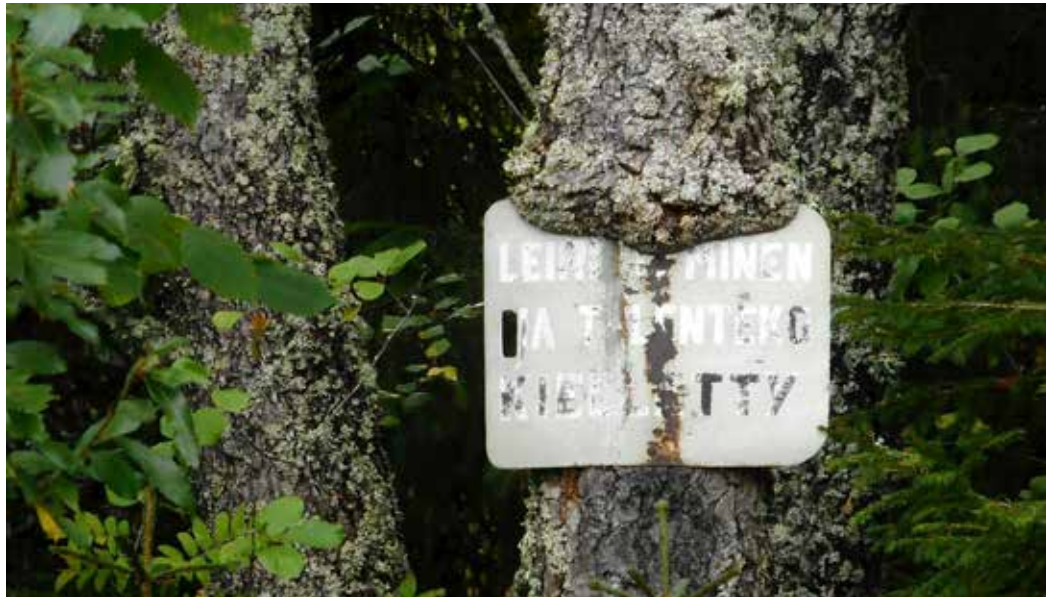
Vanha kyltti kieltää ihan oikeutetusti tulenteon, mutta tällä alueella leiriytymistä ei voi kieltää eikä kieltoa tarvitse noudattaa.

Perinteinen jokaisenoikeus perustuu perustuslailla turvattuun liikkumisen vapauteen, lisäksi oikeuksia säätelevät useat varsinaiset lait, kuten rikos-, luonnonsuojelu-, järjestys-, maastoliikenne-, vesiliikenne-, vesi- ja kalastuslaki. Jokaisenoikeuksia on mahdollista rajoittaa, mutta rajoituksen tulee perustua johonkin lakiin.