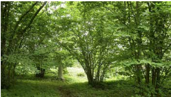
Pähkinäpensaita Hakoissa Janakkalassa.