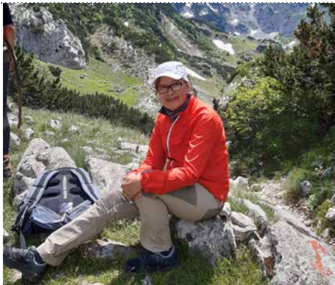
Tarja Montenergossa, jonne yhdistys teki matkan 2022.

Ensimmäiset kaksi vuotta vuokrasin putkirinkkaa, kunnes sitten ostin oman anatomisen rinkan. Puhallettava makuualusta tieten-