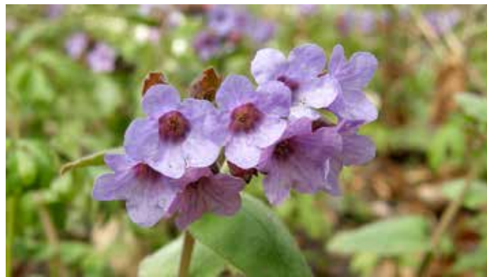
Imikkä kukkii Lammin Untulanharjulla.