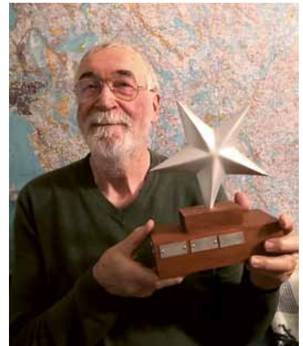
Juha ja pysti luovutustilaisuudessa 16.11.19.

Järjestöstara-palkinto luovutetaan henkilölle, joka omalla toiminnallaan on edesauttanut, innostanut ja rakentanut yhteistyötä järjestön/järjestöjen toiminnan mahdollistamiseksi maakunnassa.