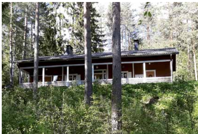
Savonlinnan Työväen Retkeilijöiden Putretti-maja on järven rannalla viehättävässä luonnon ympäristössä.

Retkikohteita kaupungissa riitti. Kävimme mm. Punkaharjun historiallisissa kohteissa sekä Lustossa Suomen metsämuseossa. Kävelimme hyvin viitoitettuja kuntopolkuja kohteista toiseen. Sade hieman kiusasi, mutta tunnetusti emme ole sokerista. Karjalan Retkeilijät ja meidän Uudentalon Liisa olivat jo ehtineet edellisenä päivänä käydä Linnasaaren kansallispuistossa.