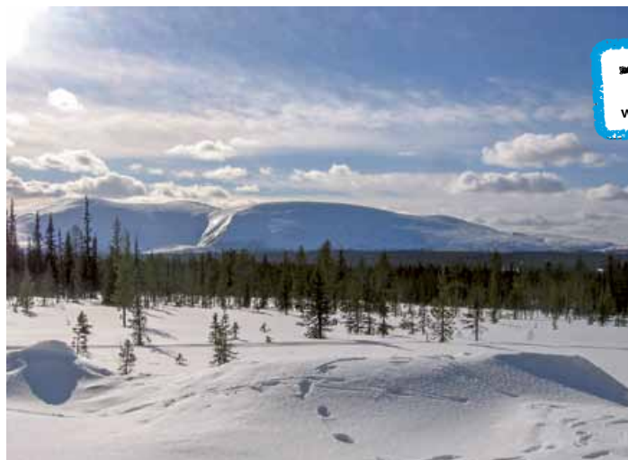
Rihmakurun majoilta avautuu näkymä Pallakselle.

Tutustu nettisivuihin www.tyovaenretkeilyliitto.com Varaa ajoissa kämpä parhaille hiihtoviikoille. Soita liiton toimistoon puh. 045 1369 744 tai sähköp. tyovaenretkeilyliitto@gmail.com