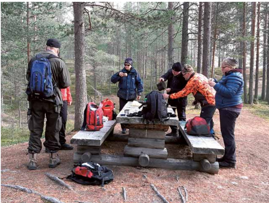
Taulla Hirsiniemen patikkareitillä Livohkassa syksyllä 2019.