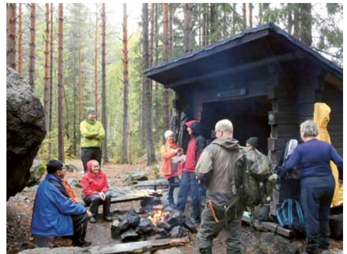
Evon luontoretki Sorsakolun laavulla.