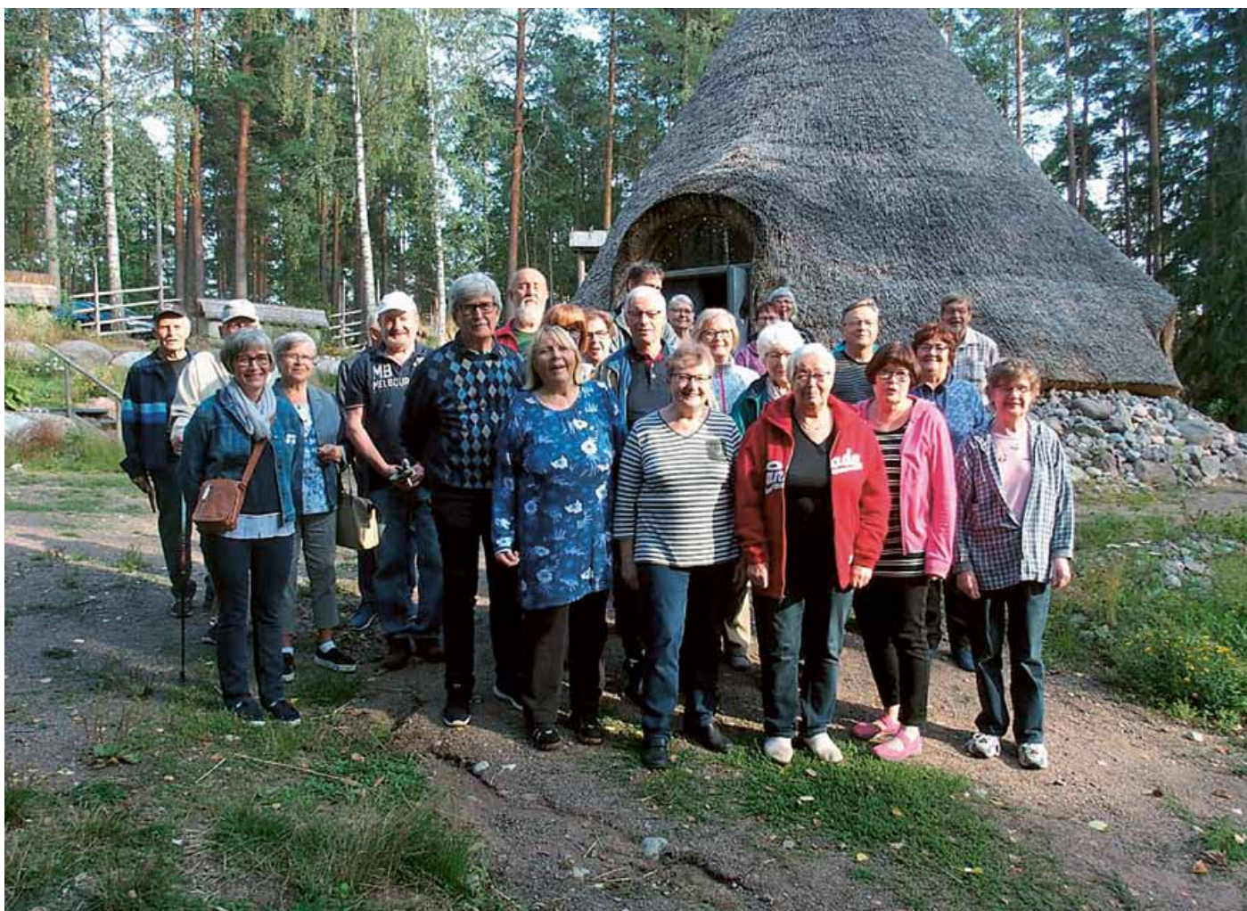
Kansanpuiston kota tarjosi retkeilyhenkiselle porukalle oivalliset puitteet.