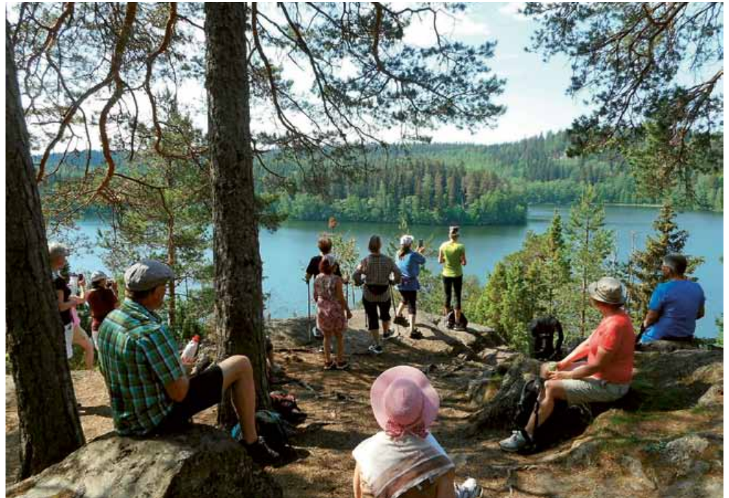
Aulanko-patikalla nautittiin hienosta ilmasta ja maisemista.

Seuralla oli aikanaan tapana mitellä erätaikisoissa osaamista ja tietämistä, mutta perinne oli katkenut. Tämän vuoden kisojen päätarkoitus oli elyvtää järjestelytaitoja. Nyt rasteilla mm. tehtiin tulia ja keitettiin kilpaa vettä, ratkottiin ensiaputehtävä, tunnistettiin puulajeja ja arvioitiin etäisyyksiä. Joka rastilla oli myös yksi tietoteh-