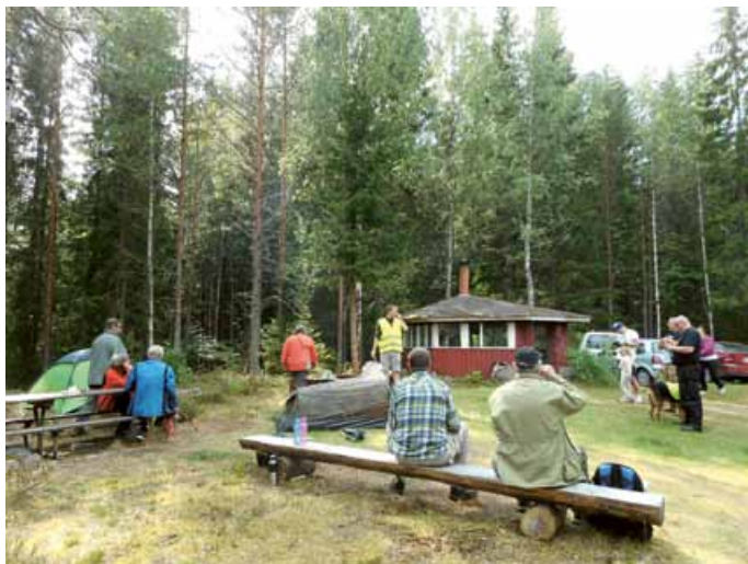
Elokuussa kisattiin erätaidoissa.