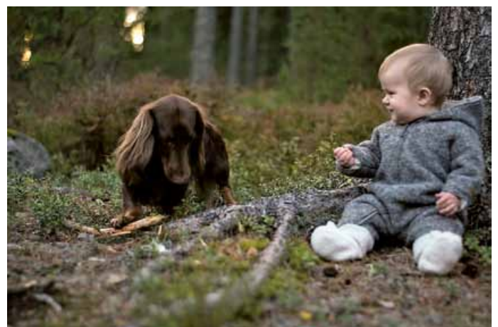
Perheen pienimmät löytöretkellä Nuuksiossa.

Minulla on koko aikuisen ikäni ollut koira, ja sen kanssa olen päivittäin samoja Espoon polkuja kiertäessäni tutussa ympäristössä tavannut lukuisia kauniita ja jännittäviäkin asioita: raatteen kukat suolla, "suomalaisia orkideoja" metsätien varressa, erivärisiä kääpiä ja jäkäliä. – Kerran keskiyöllä oli