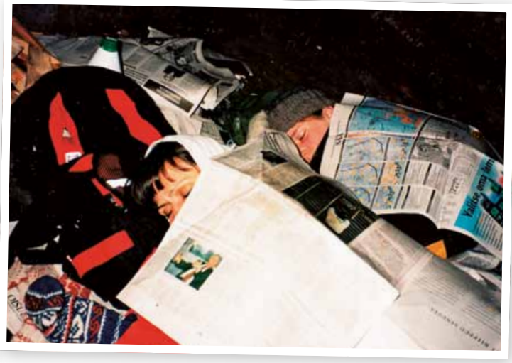
Liito-oravat olivat "suurta huutoa" v. -99 ja järjestimme "Lentävien rukkasten yön" yleisölle. Oravia ei näkynyt ja meillä väsymys kävi kypälään. Aamuyöstä alkoivat läheisen Kolmikulmalammen kaakkurit komennella poikasiaan ylen äänekkäästi. Oli pakko taapertaa jatkamaan unia omaan petiin.